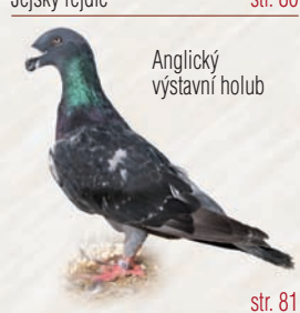
Anglický výstavní holub