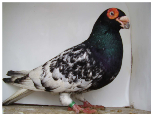
ČERNÁ ŠUPINATÁ ( pigr )