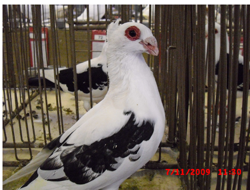
ČÁPEK ČERNÝ BĚLOPRUHÝ