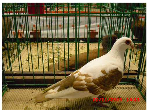
ČÁPEK ČERVENÝ BĚLOPRUHÝ